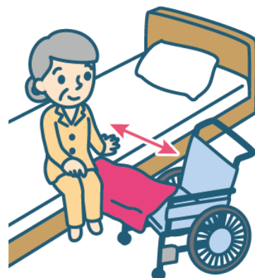
ベッド⇄車イス間の移乗に

<仕様> 寸法：W600×H500 (mm) 材質：ナイロン100% (裏表シリコンコーティング) カラー：ピンク 型式番号：SL-01 価格：1980円 (税別)